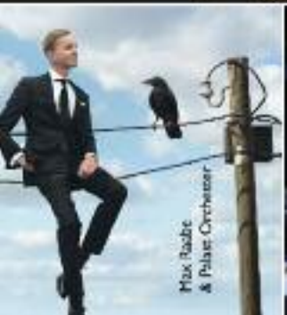
Max Raabe & Palast Orchester