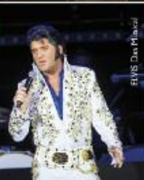
ELVIS Das Musical