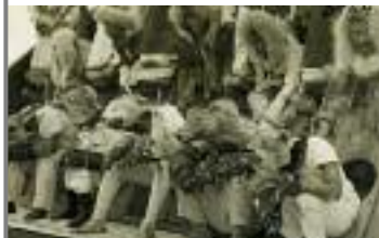
Maskenträger auf King Island während eines Wolfanzes 1924